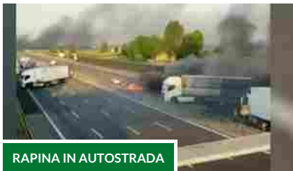
RAPINA IN AUTOSTRADA

A1, rapina a portavalori Mezzi incendiati e chiodi