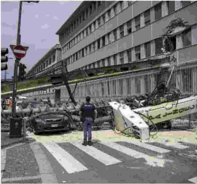
La trivella si è abbattuta sul palazzo di fronte, sventrando la sala riunioni della direzione scientifica e gli uffici amministrativi al piano terra. Poi il mezzo meccanico si è schiantato su due auto parcheggiate all'incrocio