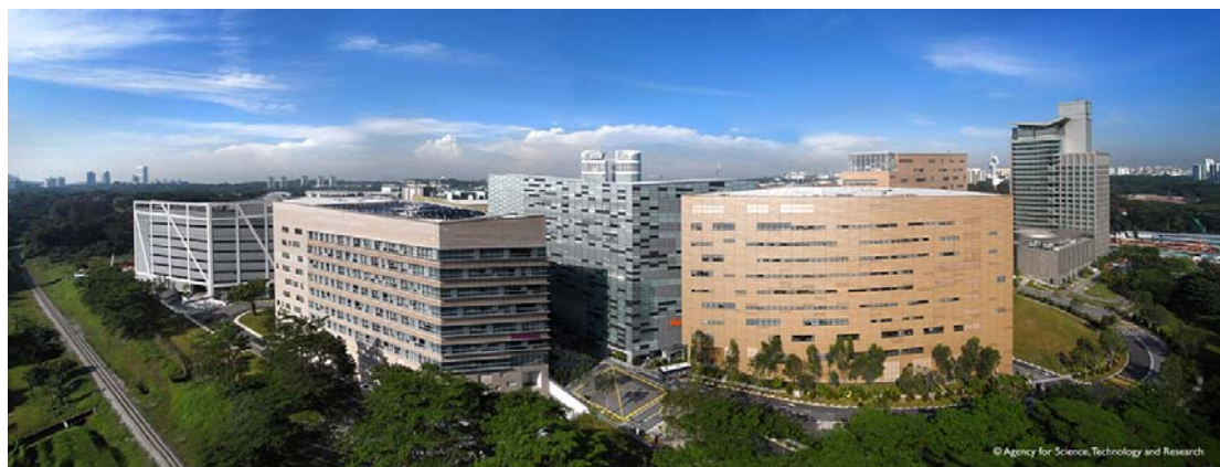
AREA BIOPOLIS VISTA AEREA

E che una collaborazione con la dinamica città-stato, riconosciuta come il quarto Polo di Ricerca a livello mondiale, potrà portare solo vantaggi anche al Sistema Italia.