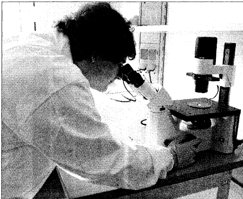
Al lavoro nell'Istituto di oncologia molecolare

Mi vesto con poco, vado dal parrucchiere tre volte l'anno. Amo il cinema ma non ho tempo di andarci, guardo i film in dvd