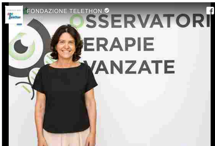
Facciamo un po' di chiarezza sulle terapie avanzate? In questo video di