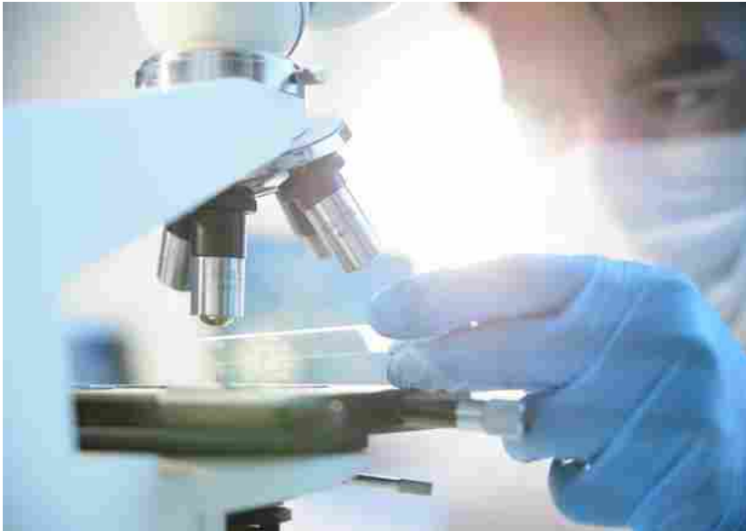
Ultimo aggiornamento: 17:07 © RIPRODUZIONE RISERVATA