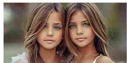
Ricordate le bellissime gemelle? Guardate dove sono ora