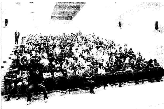
Sopra il numeroso pubblico al Paleocapa, a lato il tavolo dei relatori intervenuti