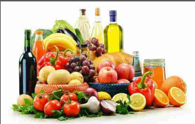
Dieta mima-digiuno contro invecchiamento e patologie

Adottare periodicamente una dieta a basso contenuto proteico, per solo 5 giorni, ogni 3-6 mesi a seconda della circonferenza addominale e dello stato di salute, e sotto controllo medico, avrebbe degli effetti positivi duraturi sullo stato di salute dell'organismo con cambiamenti in fattori di rischio associati a invecchiamento, patologie cardiovascolari, diabete, obesità e cancro. La dieta mima-digiuno (Dmd) com'è stata battezzata, è frutto di uno studio condotto da Valter Longo, dell'University of Southern California (USC) e dell'IFOM di Milano, e dimostra sperimentalmente l'efficacia di una dieta periodica che potrebbe rafforzare vari sistemi tra cui quello immunitario e nervoso e potrebbe ridurre il fattore di rischio di varie patologie incluso il cancro a seconda della circonferenza addominale e dello stato di salute. La ricerca, pubblicata sulla testata scientifica Cell Metabolism, e sul sito dell'Ifom, (Istituto FIRC di Oncologia Molecolare di Milano), dimostra gli effetti positivi sulla salute per la prima volta su tre piani sperimentali complementari: su lieviti, su modello murino e in uno studio pilota sull'uomo. "Si tratta di riprogrammare il corpo in modo tale da farlo entrare in una modalità di invecchiamento più lento, ma anche di ringiovanirlo attraverso una rigenerazione che si basa sulle cellule staminali" spiega Longo.