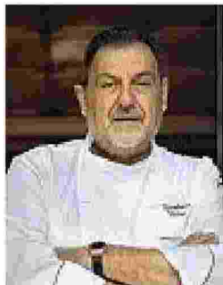
Gianfranco Vissani, chef