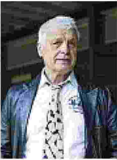
Michele Placido, attore